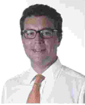
Vittorio De Luca