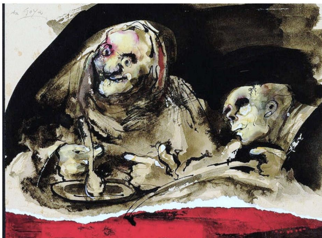
Da Goya "Vecchi che mangiano" dall'archivio di Giancarlo Vitali