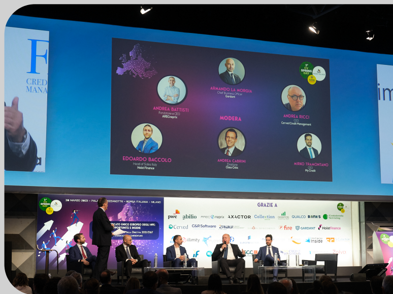
( https://cvspringday.events/wp-content/uploads/2024/01/CONV_407.jpg )